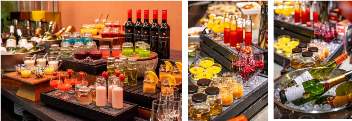
カクテルビュッフェ（イメージ）

アフタヌーンティーをご利用のお客様は、スイーツやセイボリーとのペアリングを楽しめるカクテルビュッフェもお楽しみいただけます。彩り豊かなカクテルをはじめ、ワインやスパークリングワイン、ノンアルコールカクテル、コーヒー、紅茶など多彩なドリンクをご用意。お好みの一杯とともに、EL DORADOならではの華やかなティータイムをお過ごしください。