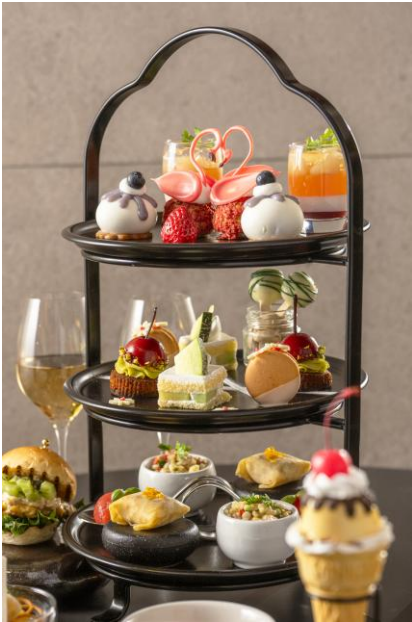
Summer Fruits Afternoon Tea