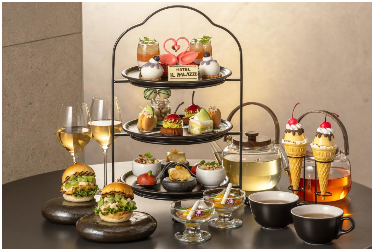
Summer Fruits Afternoon Tea

夏の果実が織りなす彩り豊かな味わいととも、HOTEL IL PALAZZO ならではの特別なティータイムをお楽しみください。