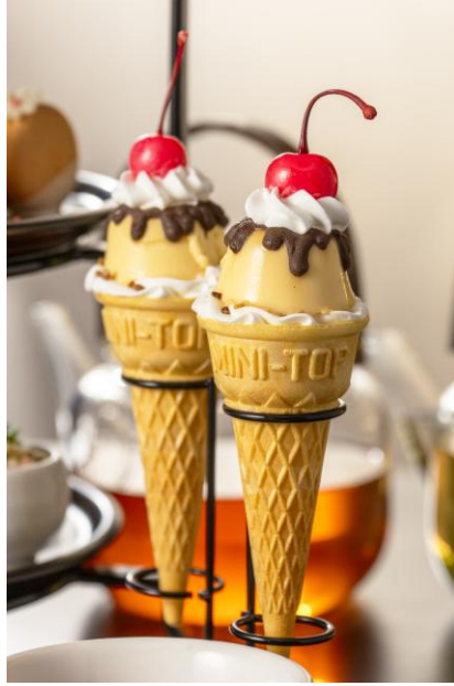
レトロプリンアイス